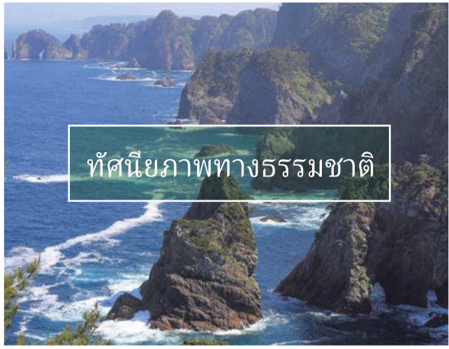
ทัศนียภาพทางธรรมชาติ