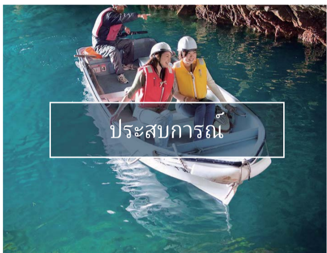
ประสบการณ์

นำเอาวัตถุดิบจากทะเลในภูมิภาคโทโฮคุ มาปรุงเป็นอาหารทะเลสดที่อร่อยที่สุดใน 1 ใน 3 ของโลก เนื่องจากในภูมิภาคโทโฮคุมีพื้นที่ชายฝั่งที่ยาวเหยียดกว่า 200 กิโลเมตร และมีแหล่งประมงที่ใหญ่เป็น 1 ใน 3 ของโลก นอกจากนี้ยังมีแหล่งท่องเที่ยวทางธรรมชาติและวัฒนธรรมที่น่าสนใจอีกมากมาย เช่น พิพิธภัณฑ์วิทยาศาสตร์แห่งชาติโทโฮคุ และสวนสาธารณะต่างๆ