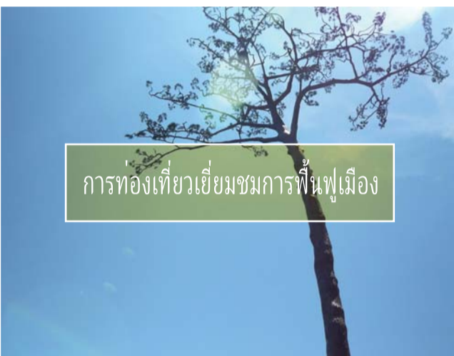
การท่องเที่ยวเชิงนิเวศในเมือง